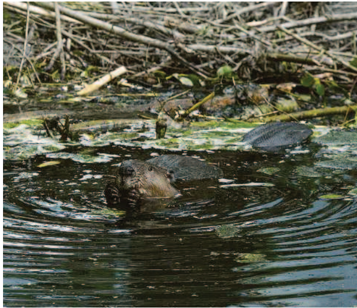
Der fleissige Biber hat seinen Damm meistens nach ein paar Tagen bereits wieder errichtet.